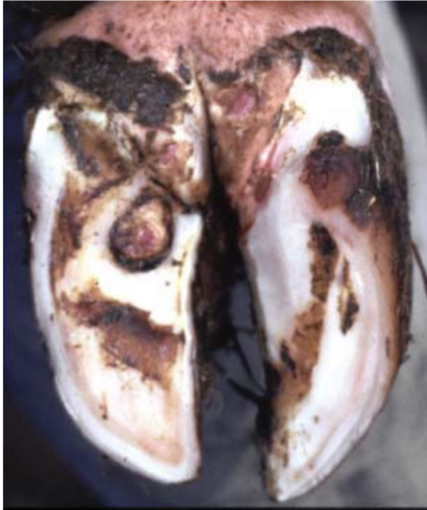
und Erkrankungen entlang der weißen Linie